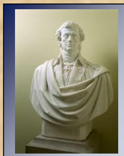
Бюст Тадэвуша Касцюшкі