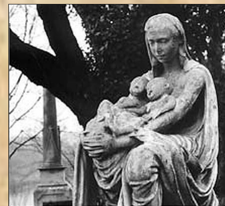
Помнік на магіле жонкі і дзяцей