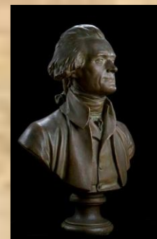
Бюст Томаса Джэферсана