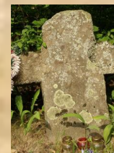
Помнік на магіле скульптара