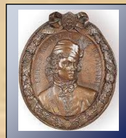
Медальён Тадэвуша Касцюшкі