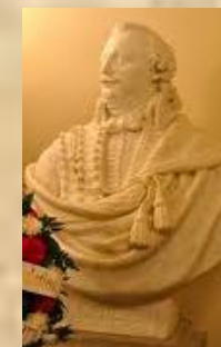
Бюст Казіміра Пуласкага