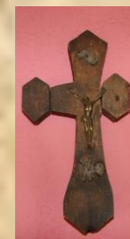
Крыж біскупа К. Дмахоўскага