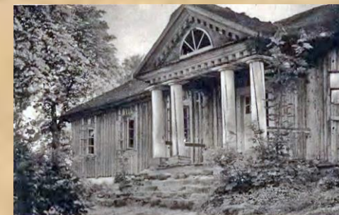
Сядзіба ў Забалоцці XVIII ст.

Трымаў Сусвет З гняздом у Забалоцці. Скульптурай волі Уяўляў народ... А карнікі у злосным карагодзе шукалі, дзе жыве Іскарыёт. За трыццаць срэбраных прадаўся Юда і выдаў патрыёта пад кап'ё... ...Праз дзвьесці летаў мы чакаем цуда: затопчыцца калючае куп'ё, – Мы знойдзем Пераброддзе ў пагодзе, пазнаем запавета пазнацвет. ...Адчуем поўніцу ў сваім народзе, – прылашчым і Дмахоўскага Сусвет. 2003